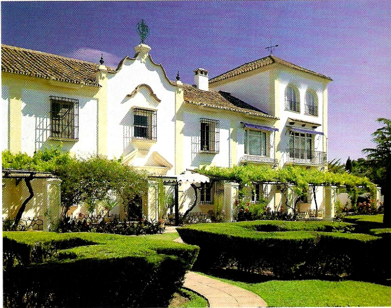
Casa Club de Santa María Golf.

se debe sobre todo a "la buena relación calidad/precio que ofrecemos aquí y que nos permite una mejor captación de clientes que otros campos".