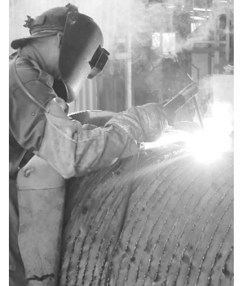
El incremento de la productividad estará en el centro de los debates.