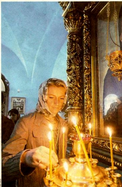
Actualmente en España existen dos templos ortodoxos rusos.

Para el diseño del templo, el estudio de arquitectura español contará con el apoyo de especialistas rusos, que en su momento vendrán desde Rusia (es el caso de los artistas que pintarán los murales con las representaciones de la vida de los apóstoles). Y aunque el diseño final no esté totalmente