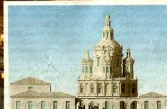
Imágenes de la futura catedral que se levantará en San Pedro de Alcántara (Marbella).